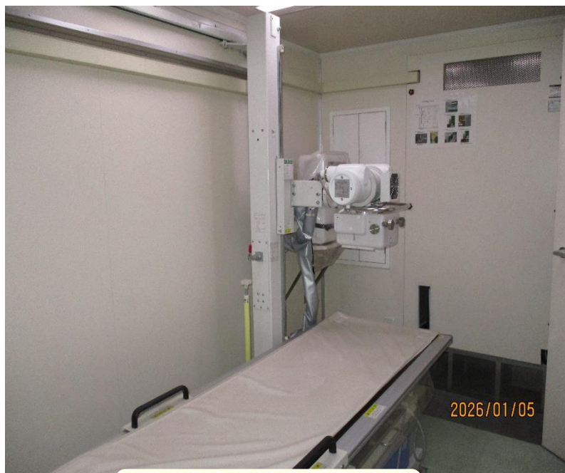
(胸部レントゲン機器)

巡回診療船「済生丸」に搭載しているレントゲン機器が、このたび新しい機器へ更新されました。クラウドファンディングを通じて多くの皆様からお寄せいただいたご寄付により実現したものです。心より感謝申し上げます。