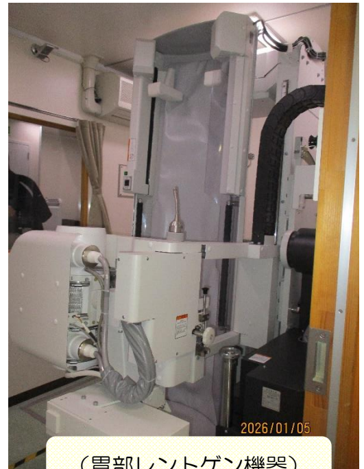
(胃部レントゲン機器)

新しい機器の導入により、より安心・安全な検診を行うことが可能となりました。済生丸はこれからも、「すべての人が安心して医療を受けられる社会」の実現にむけて全力で取り組んでいきたいと思います。